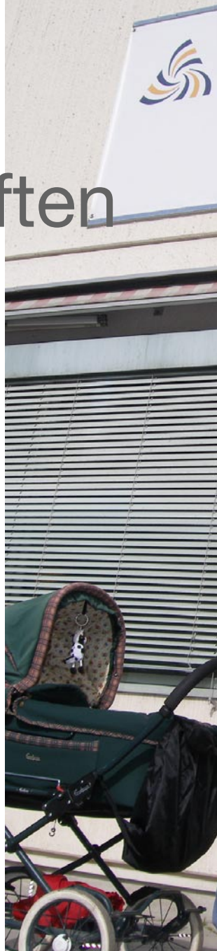
▲ Under en livstid går nästan hälften av skatten tillbaka till den betalande individen själv.

82 procent av de 6,8 miljoner kr som genomsnittssvensken betalar i skatt under sitt liv går tillbaka till den betalande individen själv. Redan samma år som skatten betalas kommer nästan hälften tillbaka. Det beror framför allt på att många transfereringar, som exempelvis pensioner och sjukpenning, är skattepliktiga. Skattebetalande hushåll får också fortgående del av offentliga subventioner, som exempelvis barnomsorg, utbildning och äldreomsorg. Den del av skatten som kommer tillbaka